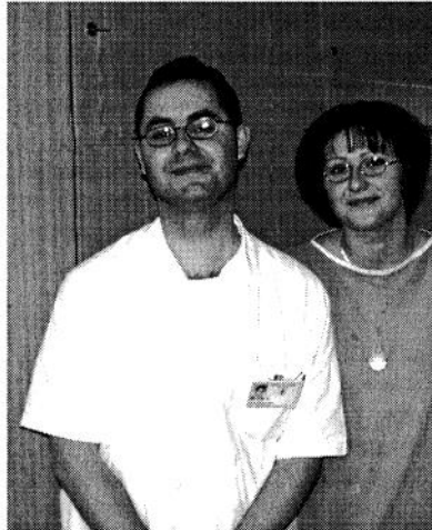
A pak že diplom z vás lepšího člověka neudělá

kvůli zkušenosti, ne kvůli penězům. Aspoň ne v současné době. Budu možná mluvit jinak za 4 roky, pokud budu mít děti.