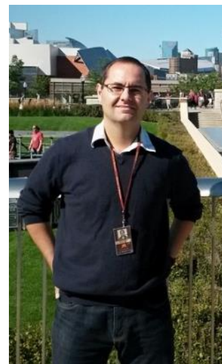
Stáž na Minnesotské univerzitě v rámci Proshek-Fulbrightova stipendia (2015)