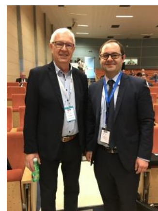
Setkání s prof. Jiřím Drahošem na olomouckém THE Research Excellence Summit (2018)