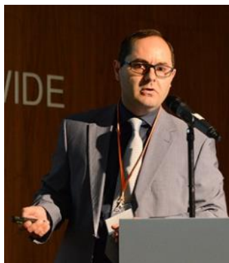
Na mezinárodním kongresu Olomoucké hematologické dny 2017

VP: Silné stránky jsou naše tradice, stabilita, organizační uspořádání (1 fakulta, 1 nemocnice), dobrá finanční kondice. Jako slabé stránky vidím rigiditu kurikula, nevyužitý potenciál anglických studijních programů, nevyužitou kooperaci a sdílení procesů s rektorátní úrovní a možná malou elektronizaci některých postupů. Příležitostí je ohromný lidský a materiální kapitál obou institucí – fakulty i nemocnice. Rizika vidím hlavně v udržení kvality výuky při navýšení počtu studentů, nutnost dobudování zázemí a také v možné ekonomické nestabilitě v budoucnu.