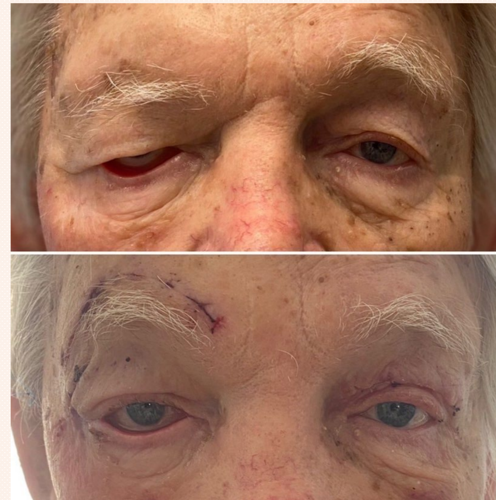
Obr.1 Pacient s blefaroptózou a ektropiomom dolného viečka, a po rekonstrukcii

Metodika: Do retrospektívnej štúdie boli zahrnutí pacienti v rokoch 2017 až 2020, ktorí podstúpili operáciu viečok. Dáta sme získali z operačných protokolov. Celkovo ich bolo 222 a dokopy bolo na nich vykonaných 288 operácií. Zisťovali sme najčastejšie typy operácií a najčastejšie dôvody revízií.