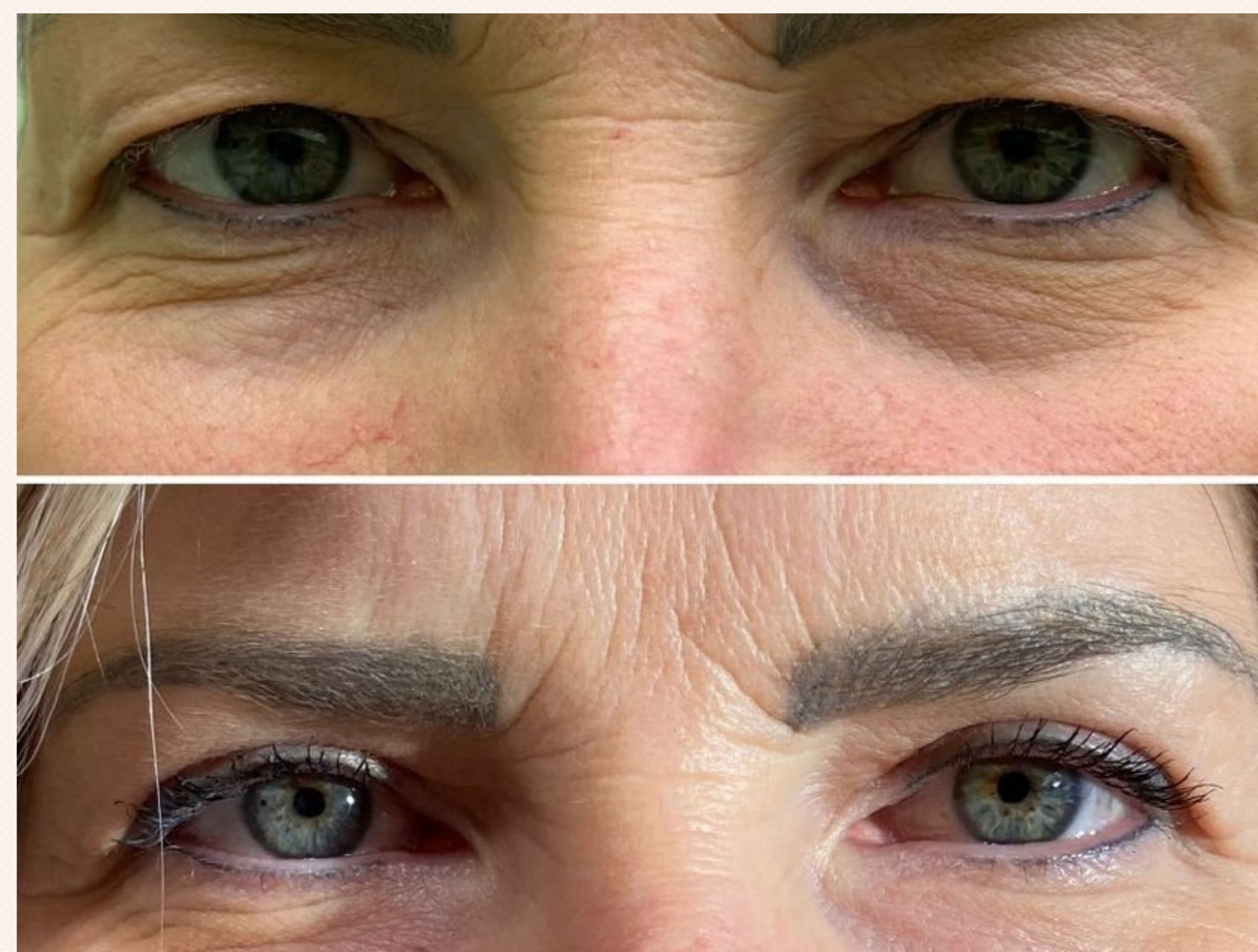
Obr.2 Pacientka s blefarochalázou a po blefaroplastike