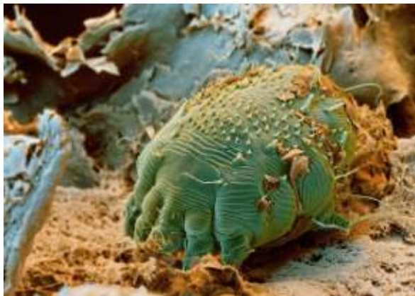
Obr. 1 – zákožka svrabová 1