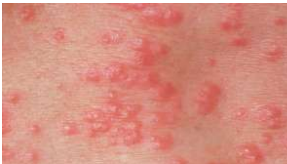
Obr. 3 – kožní vyrážka 1