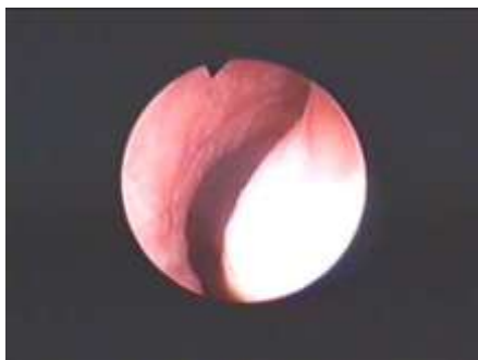
Obr. 2: Pohled na tumor při endoskopickém vyšetření jícnu