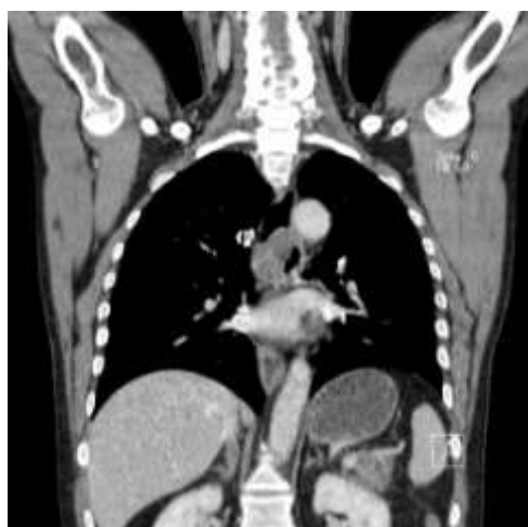
Obr. 4: Zobrazení tumoru při CT vyšetření