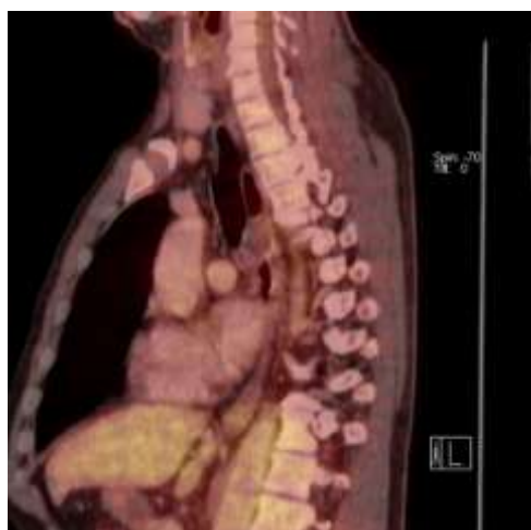
Obr. 3: Zobrazení tumoru při PET/CT vyšetření