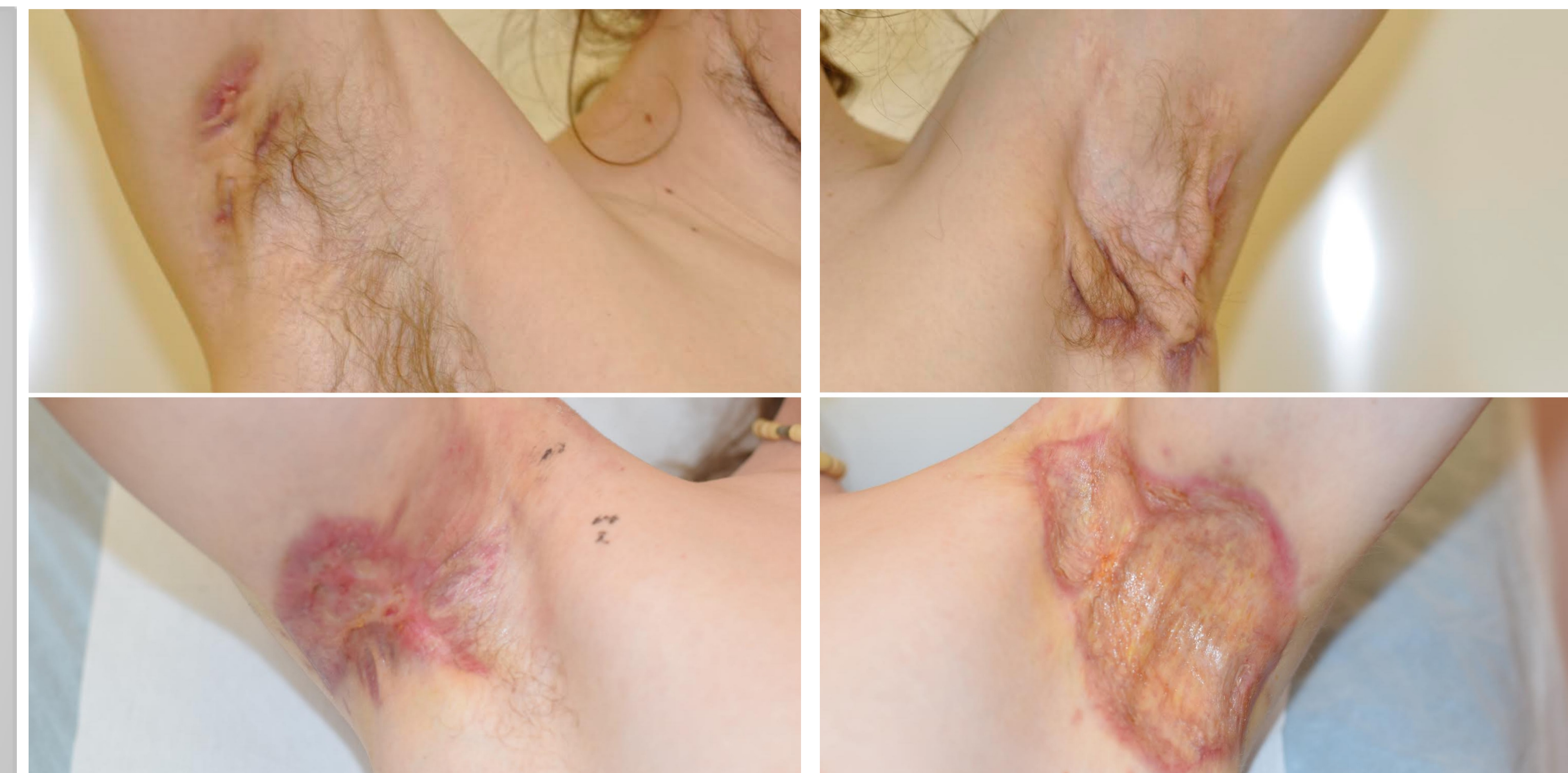
Obrázek č.1: Postižená pravá axila před operací a 14. pooperační den.

Při počtu 36 pacientů (M 22: Ž 14) bylo vykonáno 85 operací. Průměrný věk pacientů byl u mužů 49,18 a u žen 41,07 roku. Nejčastěji postižené byly axily (39,58 %), inguina (16,67 %) a oblast genitálu (12,5 %), u 22 pacientů byla postižena více než jedna oblast. Nejčastější operační technikou byla excize a sutura (21 %), excize a VAC (20 %), excize a dermoepidermální štěp v 2. době (20 %), excize a místní posun (15 %). Až 52,78 % pacientů kouřilo a 22,22 % pacientů byli diabetici. Recidiva se vyskytla u jedné pacientky a byla vyřešena excízi a suturou.