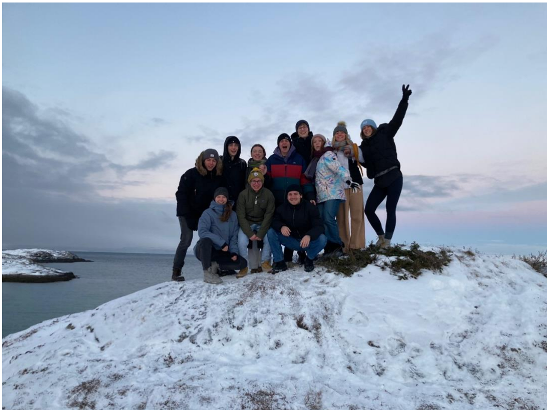
Pozdrav zo severného Nórska v belgicko-nemecko-taliansko-lotyško-slovenskom zložení