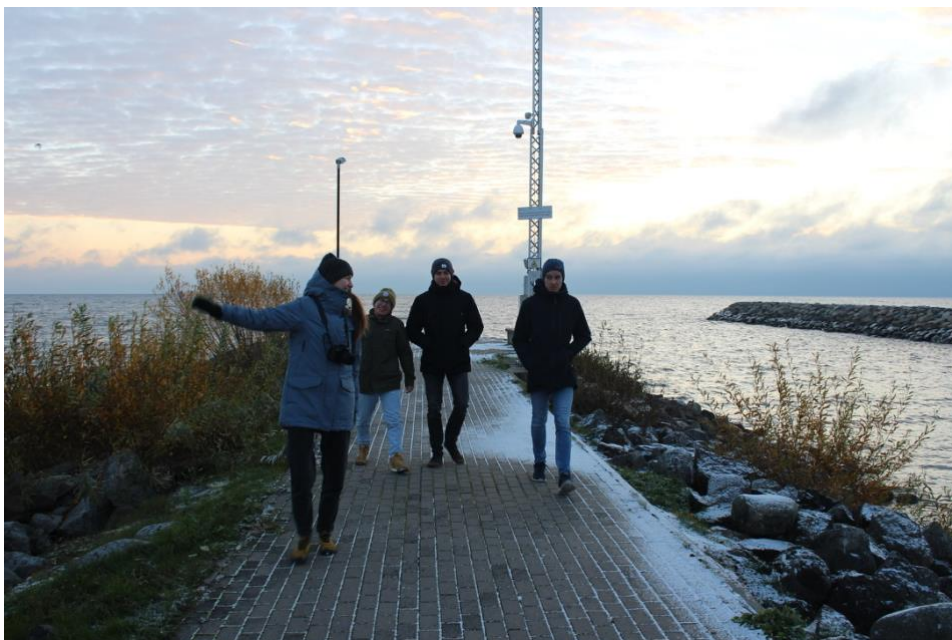
Čudské jazero (Peipsi lake) z Mustvee a hviezdna crew