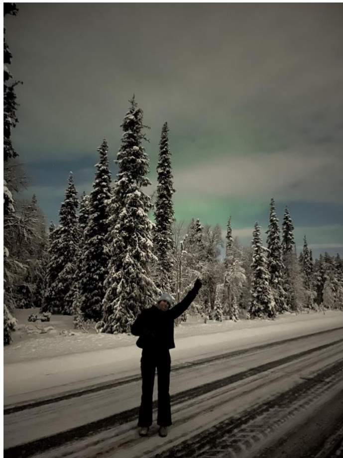
Aurora za oblakmi