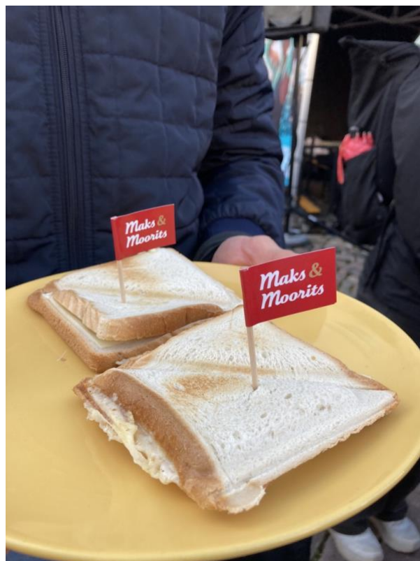
Trochu nedopečené toasty na študentských dňoch v Tartu – ale inak dobré boli :D