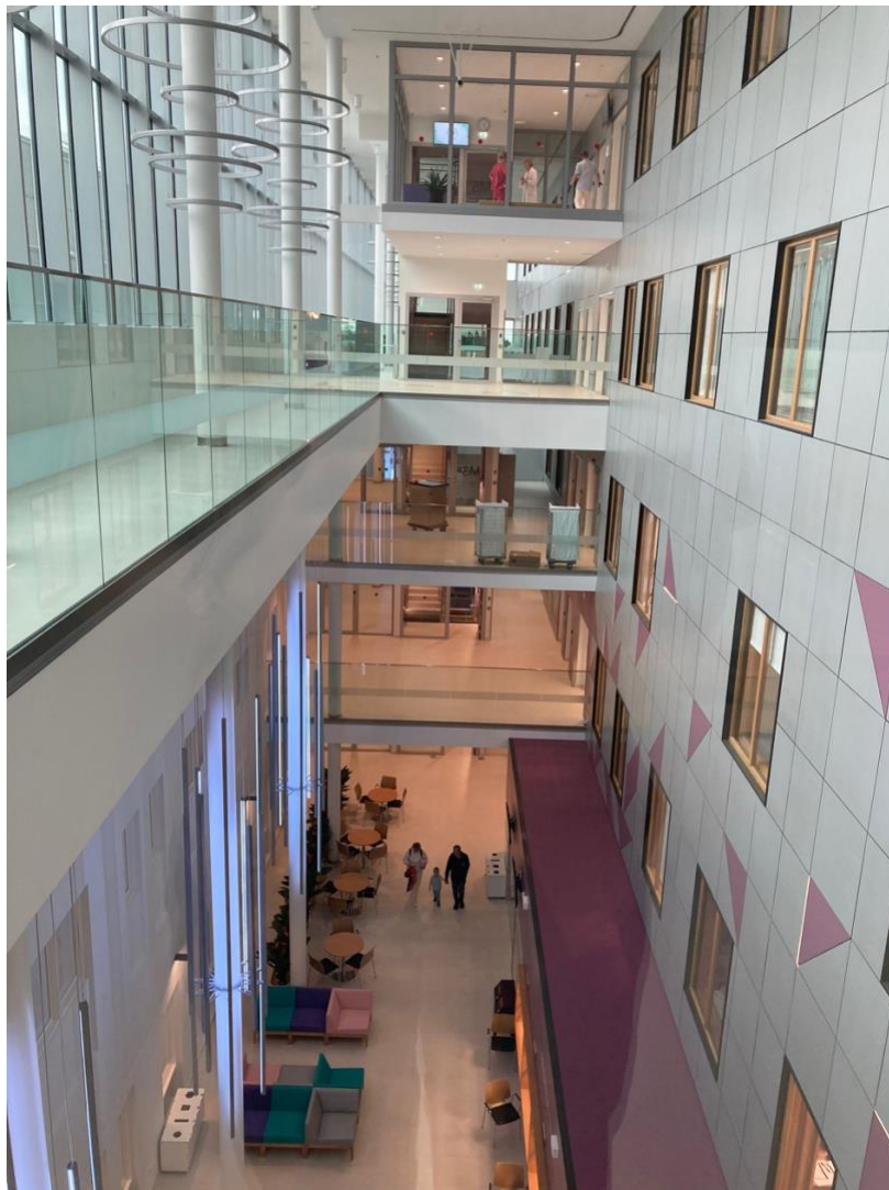
Nemocnica v Tartu

Samozrejme aby to nevyzeralo, že sme tam len chodili po výletoch a nie do školy :D, zmienim sa aj o výuke. Pobyt sme absolvovali v 5. ročníku behom zimného semestra. Predmety: gynekológia a pôrodníctvo, anestéziológia, onkológia, ORL a očné. V princípe podobná forma výuky ako u nás, máte prednášky a praktika, prednášky povinné nie sú, ale odporúčam chodiť, snažia sa ich robiť naozaj zaujímavé. Praktika prebiehajú ako u nás, čiže plášte, prezuvky a beháte po nemocnici. Skúšky sú písomné, ale snažia sa otázky stavať viac na klinických prípadoch než na teoretických znalostiach vytrhnutých z kontextu, to znamená, že ste viac nútení rozmýšľať klinicky, vrátane dif.dg. a hlavne rozhodnúť, kedy je nutné pacienta odoslať k špecialistovi. Osobne to hodnotím veľmi pozitívne. Skúšky sú vždy po skončení bloku. Materiály Vám vždy poskytnú vyučujúci. Spolužiakov sme mali najmä z Fínska, ale aj Erasmus študentov z Nemecka, Pakistanu, Ukrajiny.