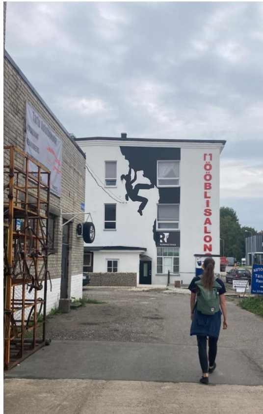
Cesta na lezeckú stenu