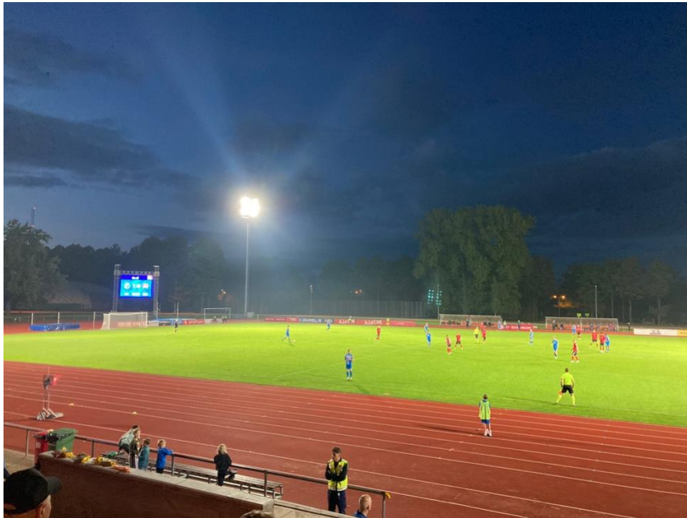
Futbalový zápas Tartu – Voru (Tartu vyhralo)