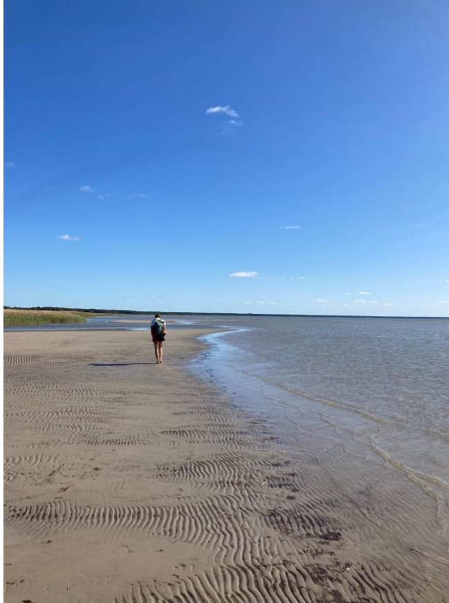
Katka a estónske pobrežie