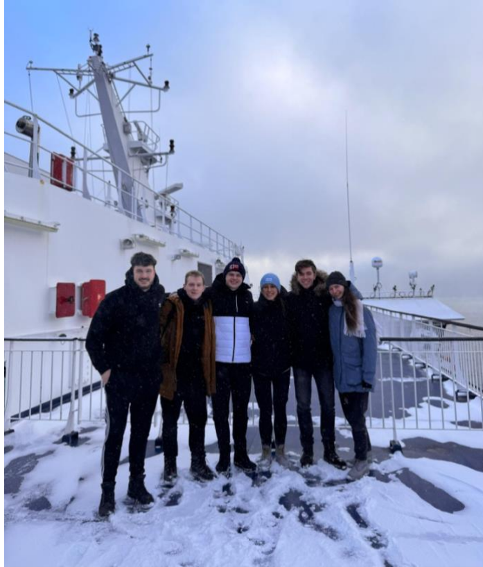
Trajekt Helsinki – Tallinn a slovenská partia z Tallinnu