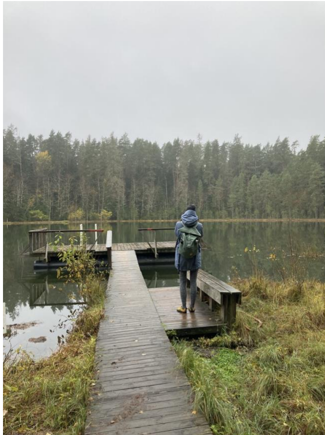
Katka a močiare